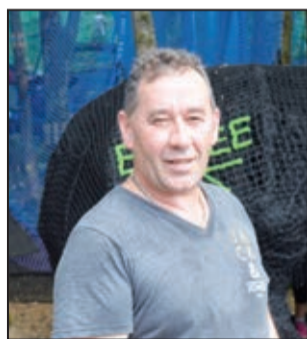
Christian, 43 ans

«C'est vraiment génial... et très physique ! On peut sauter, courir, faire ce qu'on veut. Le parcours et les différents jeux sont très intéressants. C'est différent du trampoline : c'est encore mieux. On saute plus haut, et on n'a jamais peur de retomber. De plus, aucun risque de se faire mal. Rien à redire».